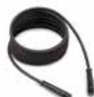
TUBO A.P. 15 m: TBAP 40062 20 m: TBAP 44379