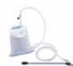
SACCO SABBIA + LANCIA LCPR 14858