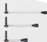
LANCE DOPPIE 30 cm: LCPR 12981 50 cm: LCPR 12982 70 cm: LCPR 12983